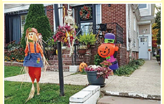
Так украшают дома в США перед Хэллоуином

Затем ведущий в костюме древнего мудреца, а в настоящей жизни - менеджер одной крупной алкогольной фирмы, сказал тост и пригласил всех поучаствовать в конкурсах. Ему помогла девушка-эльф (бухгалтер в той же фирме).