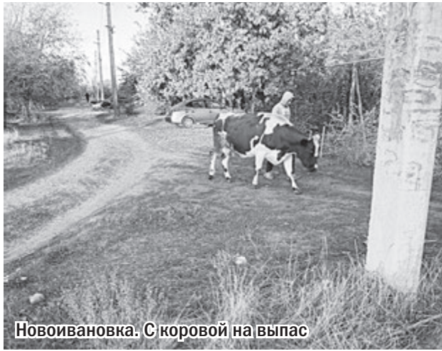
Новоивановка. С коровой на выпас

моя корова давала 15 литров молока в день, то этим - 7-8. А все потому, что травы было очень мало, и вся она была сухая. Приходилось разбавлять рацион буренки всякими добавками, а это сейчас не дешевое удовольствие.