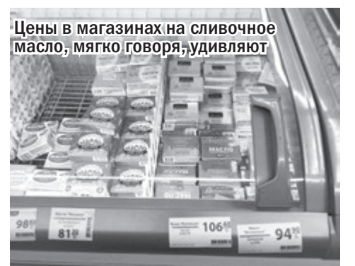
Цены в магазинах на сливочное масло, мягко говоря, удивляют

- И вся молочка будет дорожать еще. Почему? Чтобы прокормить корову в зимний период - а это с ноября по апрель, - мне нужно заготовить: три тонны сена, одну тонну соломы, одну тонну ячменя, одну тонну макухи, 0,5 тонны жмыха, - поясняет собеседница. - А цены на корма в этом году очень сильно повысились. Тонна ячменя сейчас стоит 7000 грн., макухи - 13000 грн., сена - 7000 грн., соломы - 3000 грн., жмыха - 15000 грн. И вот теперь можете сами посчитать, сколько нужно денег, чтобы