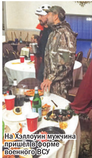
На Хэллоуин мужчина пришёл в форме военного ВСУ

Мои знакомые украинцы 31 октября собрались на костюмированный корпоратив в польском культурном центре (украинского в том городке, где я жила, нет). Зайдя в зал, я увидела круглые столы, за которыми сидело по четыре человека. На столах стояли блюда украинской кухни: оливье, селедка под шубой, вареники, картошка с мясом, фаршированный перец и т.д. Каждый гость принес с собой те блюда, что приготовил. За про-