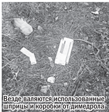
Везде валяются использованные шприцы и коробки от димедрола

Высота дров должна соответствовать высоте башен. Если нужно, используйте шести или ветки, чтобы предотвратить падение поленицы. В завершение накройте дрова брезентом для защиты от осадков.