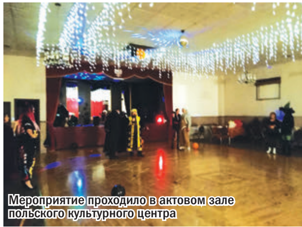
Мероприятие проходило в актовом зале польского культурного центра

Готовиться к нему в США начинают задолго до октября. В каждом магазине уже в августе появляются отделы, в которых продаются подарки для всей семьи на Хеллоуин, костюмы для маскарадов, разные вещички-ужастики для украшения домов. И много-много искусственных и настоящих тыкв и сладостей.