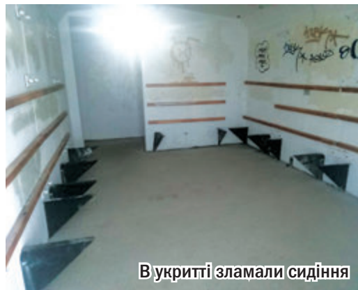
В укритті зламали сидіння

- І всі ці вандалські дії - не героїство. Герої - там, на передовій, - пише Олександр Вілкул. - Модульні укриття поставлені на вулицях для безпеки містян під час повітряної тривоги. Їх стан - це може бути питання життя та смерті. А зупинки - це захист від дощу та негоди, адже